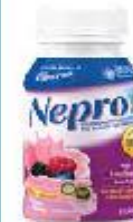
NEPRO, ENSURE CLEAR, BOOST GLUCOSE, SUPLENA